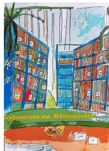
Рисунок библиотеке подарил учащийся 167 школы Андрей Калягин.

Муниципального бюджетного учреждения «Библиотека им. Маяковского».