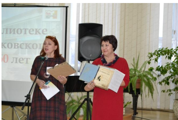
директор библиотеки им. Маяковского

Накануне своего 60-летнего юбилея библиотека пригласила горожан на Экскурсию по отделам книгохранения , закрытых от глаз своих читателей.