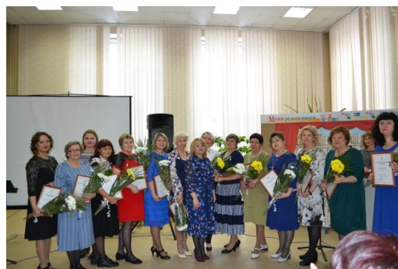
коллектив МБУ «Библиотека»

В честь 60-летнего юбилея в Солнечном зале библиотеки прошла церемония награждения сотрудников библиотеки Маяковского.